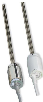
Otopný žebřík, 60x 129 cm, bílý Výrobce Thermal Trend, prohnutý, elektrické topné těleso s termostatem, v hodnotě 5 045,- Kč

Rozsah zařizovacích předmětů je kalkulován dle jejich počtu v půdorysném řešení standardního vyobrazení katalogu domu (černobílý půdorys), v příplatkovém rozpočtu je kalkulace dle nadstandardního vyobrazení katalogu domu (barevný půdorys). Při individuálních vyobrazení odpovídá rozsah domluvenému počtu nebo vyobrazení individuálnímu půdorysu stavby.