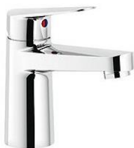
Umyvadlová stojánková baterie (chrom), Vigon, bez výpusti, clic –clac, chrom, zátka velká V hodnotě 2 090,- Kč