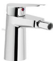
Bidetová stojánková baterie (chrom), Vigon, bez výpusti“clic-clack“, zátka v hodnotě 2 021,- Kč